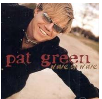
Album & single "Wave on wave" © 2003