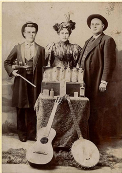
Un trio de medicine show ou comment attraper les gogos en musique !

La version de Old Crow Medicine Show a été certifié platine par la "Recording Industry Association of America" en Avril 2013. La chanson a été interprétée de nombreuses fois, la plus célèbre par Darius Rucker en 2013, qui en a fait un N° 1 Hot Country Songs, et les Irlandais chanteur Nathan Carter en 2012.